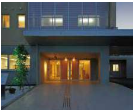
エントランス 夕景