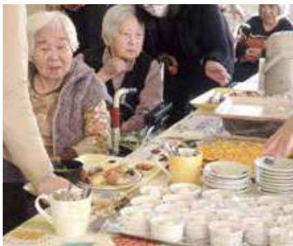
朝からビュッフェ