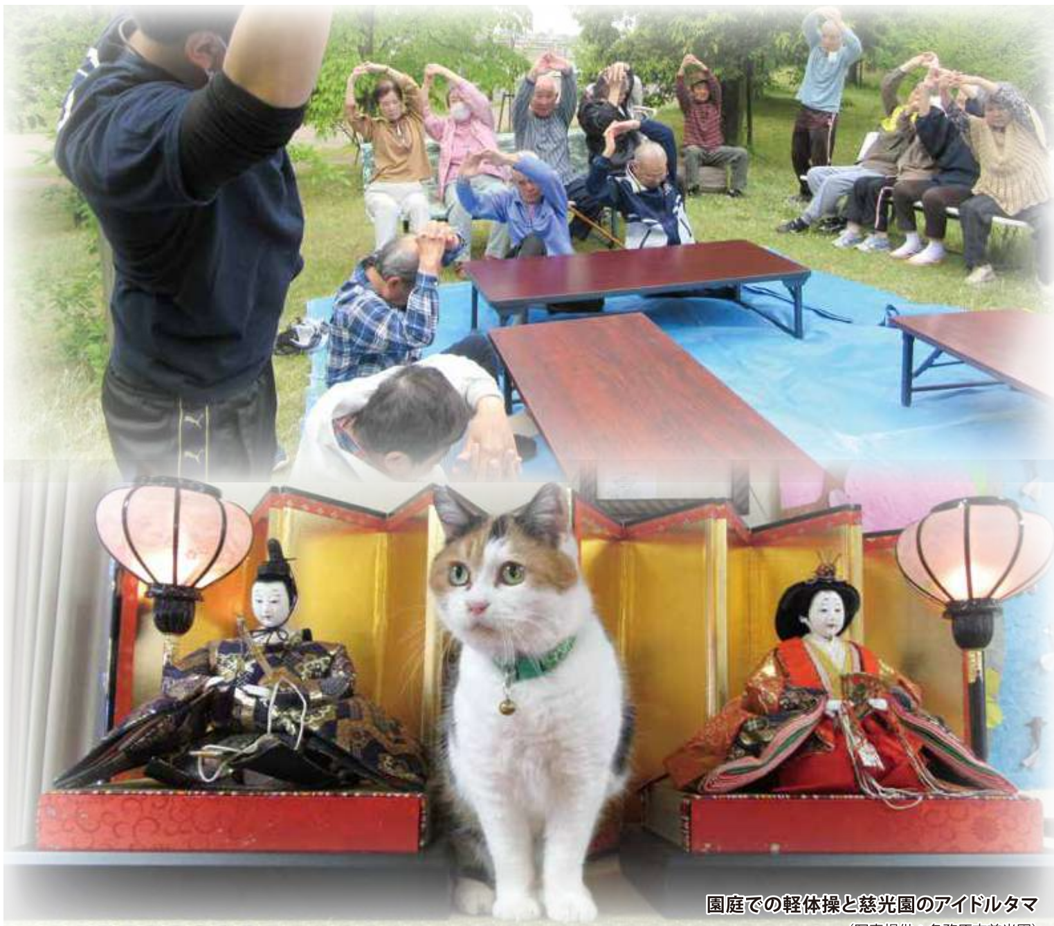
園庭での軽体操と慈光園のアイドルタマ